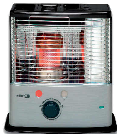
Convecteur à combustible liquide R 224 C

Points de vente : GSB, spécialistes électroménagers