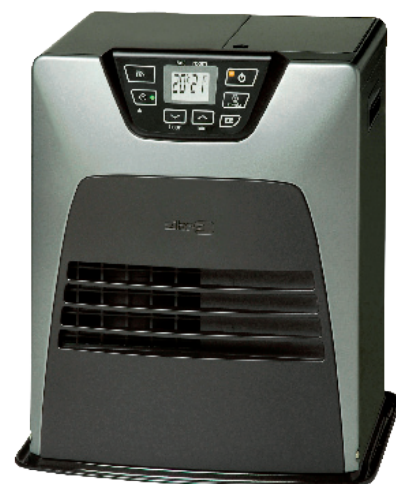
Convecteur à combustible liquide SRE231 E