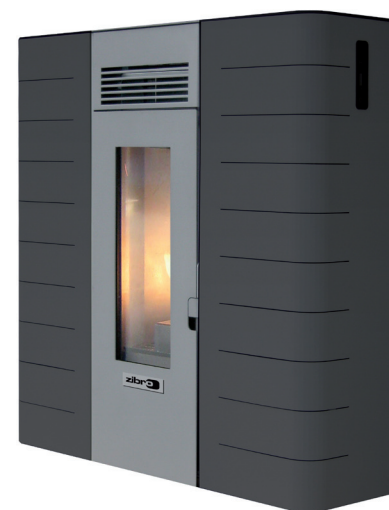
Poêle à pellets Diandra

En complément de ses poêles, Zibro propose des granulés de bois composés à 100 % de bois résineux . Aucun liant n'entre dans leur composition. Conditionnés dans des sacs de 15 kg, facilement manipulables, les pellets Zibro sont l'assurance d'un chauffage sans souci.