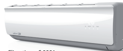
Climatiseur S 3331

Et, pour toujours plus de confort, ces appareils bénéficient d'un mode « Silence » qui rend leur fonctionnement aussi discret qu'un murmure : 25 dB pour les S 3325 et S 3331 et 30 dB pour le S 3348.