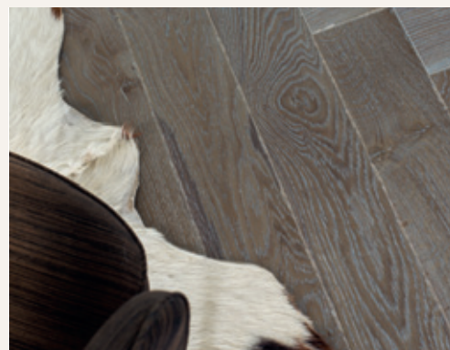
▲ Chêne Zenitude Dolmen, Bâton Rompu 139

Lumineux, chaleureux, un brin sensuel, Bâton Rompu de Panaget se pare de ses plus beaux atours pour vous séduire et embellir votre vie au quotidien. Epris de graphisme, créez vos propres décors ! En jouant avec la lumière, chaque angle de vue de la pièce offrira un véritable kaléidoscope ! Seule, la magie de ce matériau authentique qu'est le bois convie à un pareil spectacle. Le brossage du bois réalisé avec l'œil averti du ciseleur dans les ateliers Panaget, apprivoise de façon unique la lumière pour mieux la restituer.