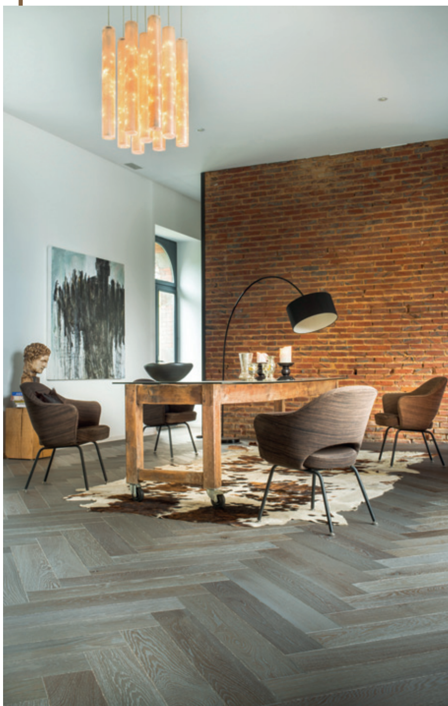
▲ Chêne Zenitude Dolmen, Bâton Rompu 139 on l'aime pour sa douceur !

Matières nobles au programme pour ce séjour contemporain. Une couleur Dolmen toute douce pour ce parquet rehaussé d'un mur de briquettes dont l'ocre illumine l'ensemble !